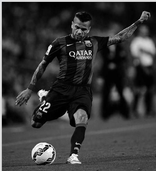
Aos 33 anos, brasileiro não mais defenderá a lateral do Barcelona, optando pela Juventus

A busca do técnico palmeirense tem sido variar o time de acordo com o adversário, mas na medida do possível, evitando que o entrosamento seja afetado. Cuca se apoia em características curingas de seus jogadores - como as constantes inversões entre Tchê Tchê e Jean, do lado direito, e Gabriel Jesus e Rôger Guedes, no ataque.