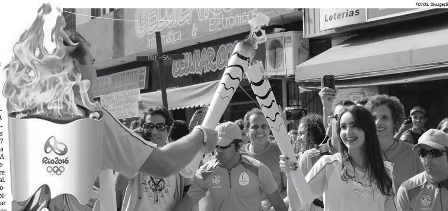
Por onde passa, a tocha olímpica vem atraindo centenas de pessoas desde que chegou ao Brasil, em 3 de maio, após ser acesa na Grécia

Dia 2 de junho - quinta-feira 12h14 .....Chegada a Pedras de Fogo 13h37 .....Chegada a Itabaiana 16h38 .....Chegada a Campina Grande Dia 3 de junho - sexta-feira 10h07 .....Chegada a Guarabira 11h26 .....Chegada a Sapé 13h22 .....Chegada a João Pessoa Dia 4 de junho - sábado 8h18 .....Chegada a Mamanguape