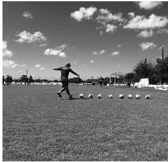
Alvinegros voltam às atividades hoje, após os 90 minutos iniciais da decisão do Estadual, ontem