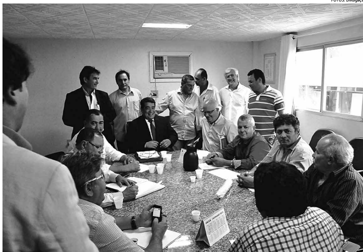
Representantes dos principais clubes do Estado estarão mais uma vez frente a frente discutindo novos rumos do campeonato