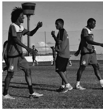
A equipe do Campinense aparece em segundo lugar na tabela

O Campeonato Brasileiro da Série D 2016 terá, ao todo, 68 clubes, divididos em 17 grupos de 4 equipes cada. A competição será disputada em 6 fases. Para a segunda fase, se classificaram os 17 primeiros colocados dos grupos, mais os 15 melhores segundo colocados, totalizando 32 times. A partir daí, a competição seguirá em sistema de mata-mata, com dois jogos a cada fase eliminatória, até chegar os dois finalistas da competição. Os quatro semifinalistas subirão para o Brasileiro da Série C, em 2017. (IM)