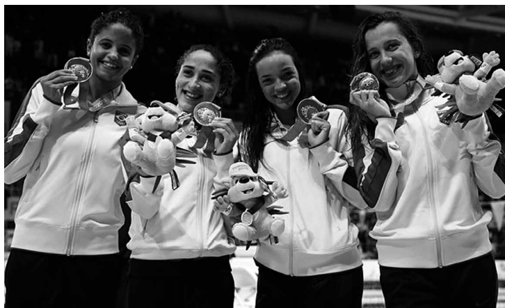
Muitas medalhas são aguardadas pelo Comitê Olímpico Brasileiro por parte da equipe de revezamento olímpico na natação brasileira

"Tomamos esta decisão, que está dentro das recomendações da Agenda-2020 do COI, para o futuro e com a perspectiva de Tóquio-2020, porque o ciclo de classificação para o Rio está muito avançado", explica a Aiba, que destaca uma "etapa adicional na evolução do boxe".