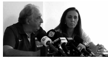
Anúncio foi feito durante entrevista coletiva da comissão técnica