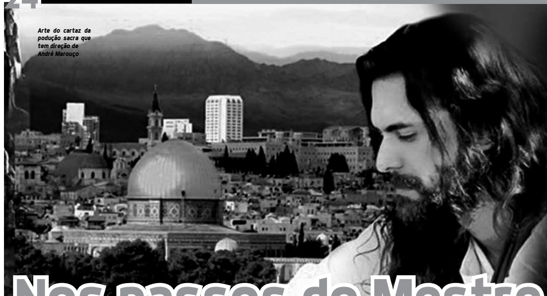
Arte do cartaz da produção sacra que tem direção de André Marouço