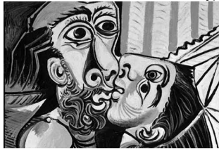
Trabalhos de Picasso no início da carreira compõem a mostra