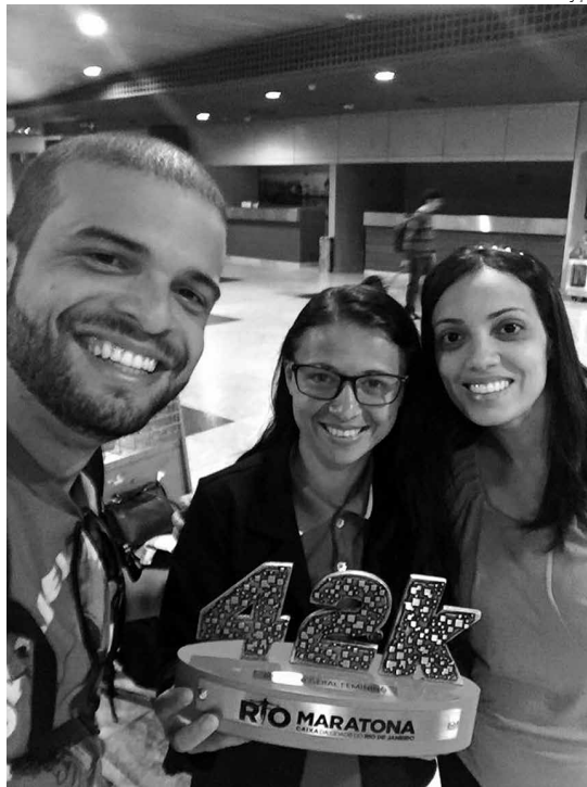
Corredora, nascida em Campina Grande, exhibe com muito orgulho troféu da Maratona do Rio