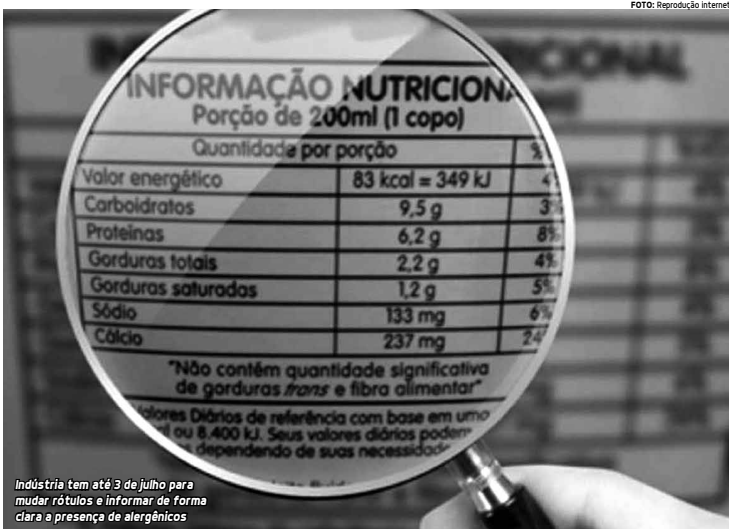
Indústria tem até 3 de julho para mudar rótulos e informar de forma clara a presença de alergênicos