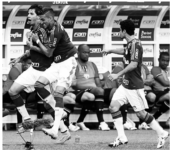
O Palmeiras vem de derrota para o São Paulo e quer dar a volta por cima diante da equipe do Grêmio

Neste cenário, a proposta de três anos apresentada pela equipe italiana atende aos desejos do lateral, que assim jogaria por um dos principais clubes da Europa até os 36 anos. Além disso, na renovação de 2015, Daniel reduziu seu patamar salarial. Não se sabe qual seria o cenário para uma nova renovação em maio de 2017.